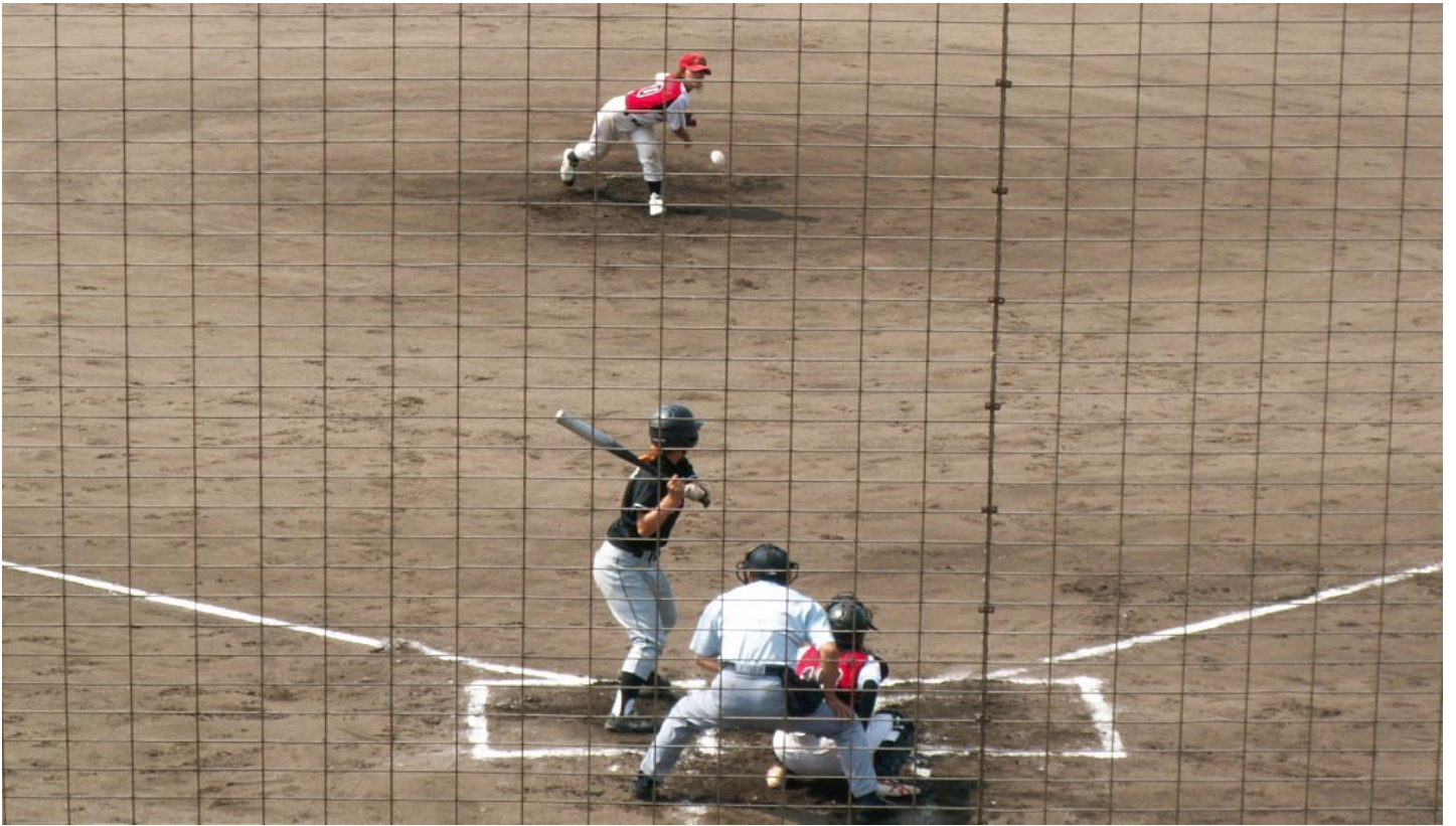
第 20 回全日本大学女子野球選手権大会